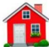
переехать за город