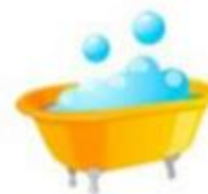
тщательно мыть ванну