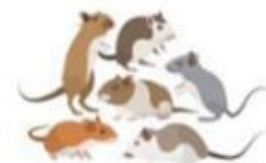
проводить обработку от грызунов