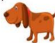
с осторожностью заводить домашних животных