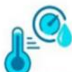
влажность не более 50%