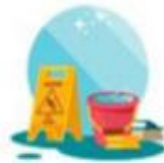
проводить влажную уборку