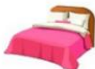
чаще менять постельное белье